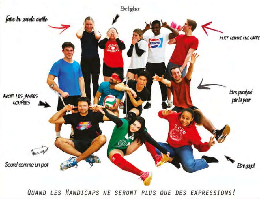
Ci-contre, photographie réalisée par Alexandra M. « Quand les handicaps ne seront plus que des expressions » (2020)