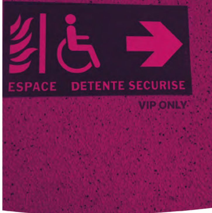
Ci-contre, photographie réalisée par Arlette D. « VIP Only » (2020)