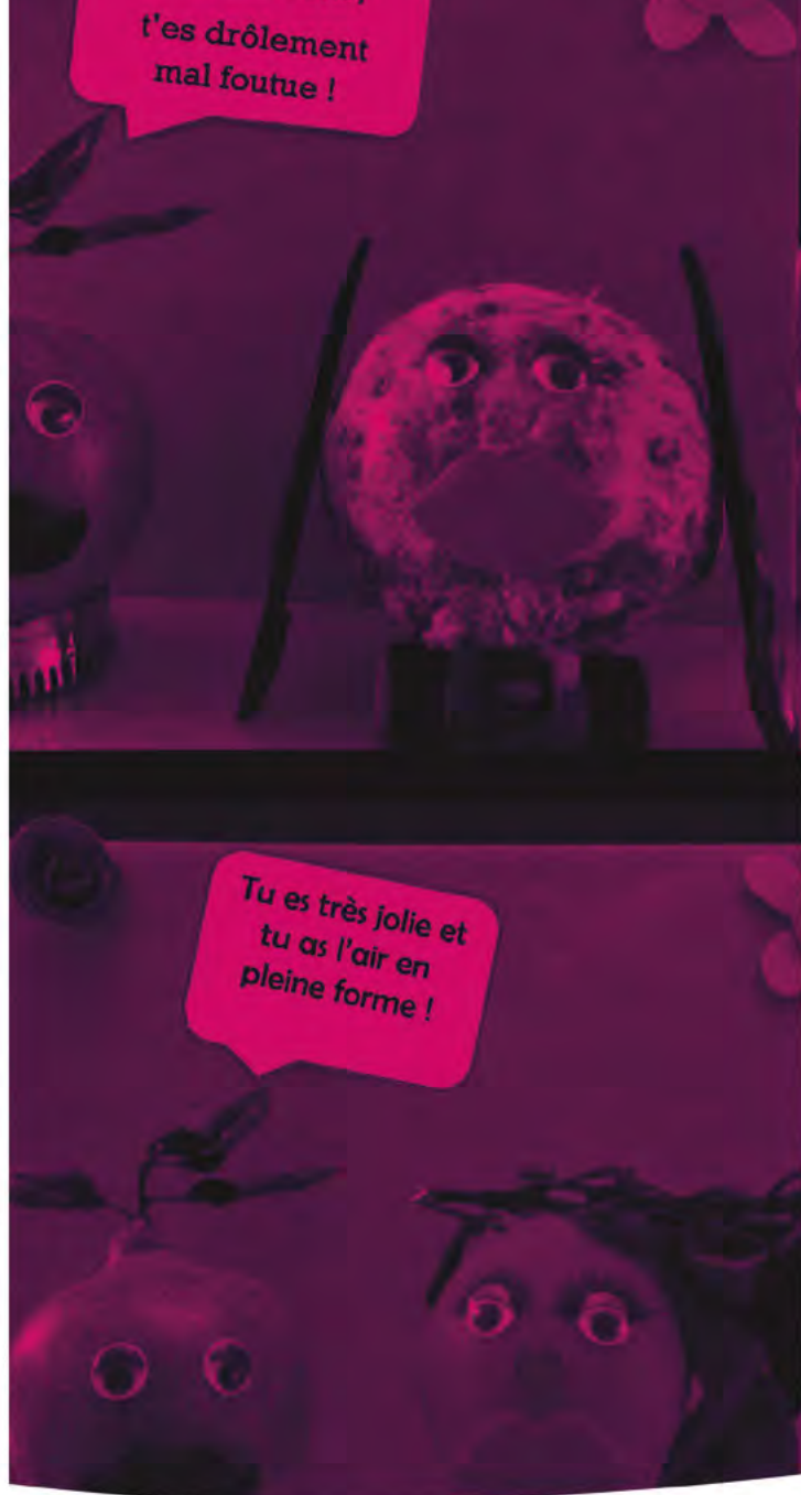
Ci-contre, photographie réalisée par Isabelle ROUSSELLE « Le handicap n'est pas toujours visible » (2020)